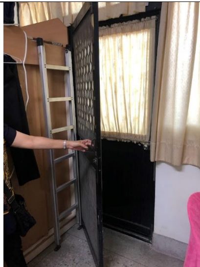
陽台門無法完全開啟