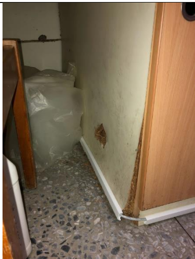
板材貼皮已翹起或破損