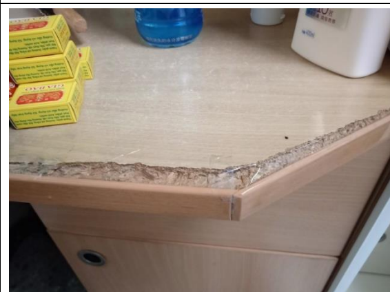
桌面板材邊緣處破損