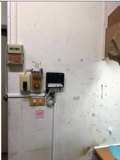
寢室牆面凌亂、留下歲月的痕跡