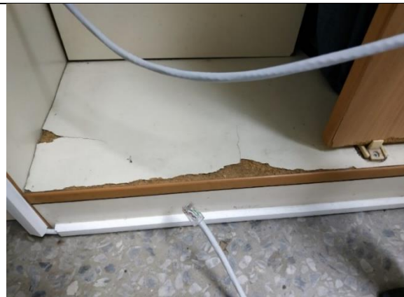
衣櫥板材邊緣處破損